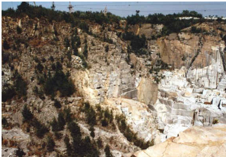
Kamieniołom w Zimniku

dwukondygnacyjny, nakryty dachem czterospadowym. Elewacja frontowa jest pięcioosiowa, elewacje boczne czteroosiowe. Obecnie dwór pełni funkcję budynku mieszkalnego. We wsi istnieją eksploatowane do dziś wyrobiska granitu. W środku wsi stoi neogotycka dzwonnica z 1869 r., służąca dawniej do zwoływania do pracy robotników kamieniołomów.