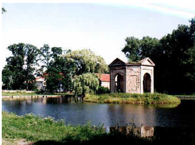
Pawilon na wyspie

Sztuczny zbiornik wodny umiejscowiony w centrum założenia to bez wątpienia relikwiny najwcześniejszego ogrodu założonego w latach 60-tych XVII wieku przez Ottona von Nostiza. Staw posiada regularny zarys bardzo przypominający kwadrat o ściętych narożach. Brzegi obudowane zostały kamieniem a do samej wody poprowadzono kamienne schody. Na samym środku zbiornika utworzono niewielką wyspę i na niej wzniesiono przepiękny czteroarkadowy pawilon istniejący do dziś.