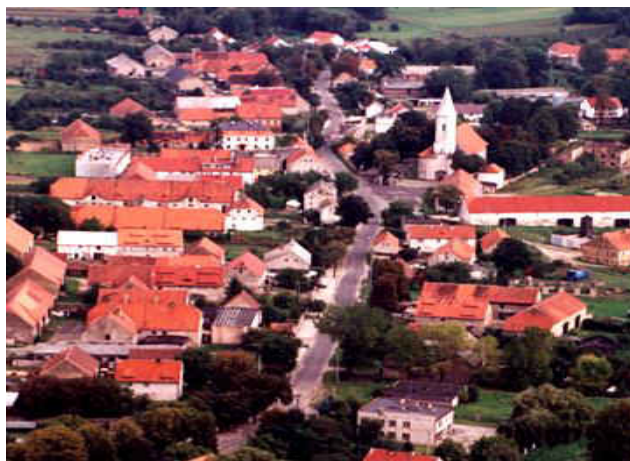
Mściwojów z lotu ptaka, fot. Ignacy Pięta

Malowniczo położona miejscowość u stóp północnego ramienia Wzgórz Strzegomskich bogata w dużą ilość zabytków kulturowych i przyrodniczych.