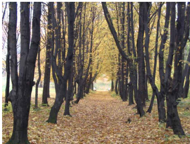
Szpaler grabowy, fot. Alina Woźnicka-Koch

Zabytkowe założenie ogrodowe obfituje w wiele wspaniałych i niepowtarzalnych okazów przyrodniczych, które warto zobaczyć. Ozdobą parku są przepiękne stare drzewa (pamiętające zapewne czasy świetności ogrodu) i krzewy. Warto zobaczyć pomnik przyrody, którym jest sosna czarna. Na uwagę zasługują również przepięknie kwitnące tulipanowce i rododendrony. Można także odnaleźć perełkowca japońskiego, cypryśnika błotnego, cisy oraz wiele innych ciekawych okazów.