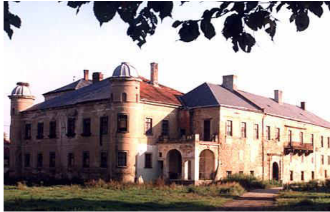
Pałac w Luboradzu

Kompleks zamkowo-pałacowy w Luboradzu zaliczony jest do zabytków I klasy. Zachowana w dobrym stanie bryła budowli została zabezpieczona nowym dachem. Zachowały się również liczne ozdoby kamieniarskie (portale i kartusze byłych właścicieli).