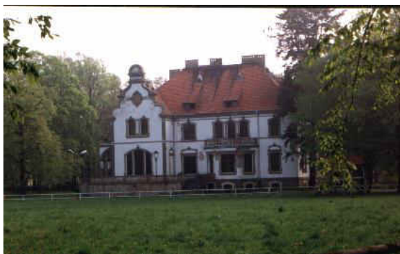
Pałac w Targoszynie

Piękny park i pałac w Targoszynie to niewątpliwie najlepiej zachowany zabytek w Gminie Mściwojów.