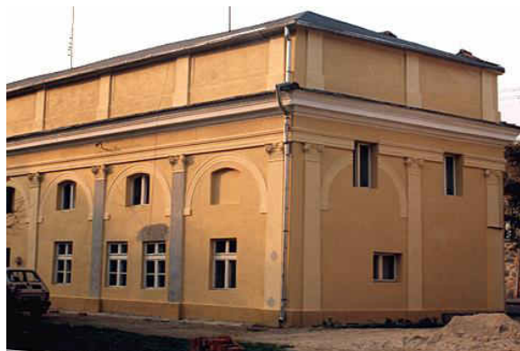
Oranżeria w Mściwojowie

W chwili obecnej w zabytkowym budynku mieszkańcy utworzyli mini muzeum wiejskie pn. „ Mściwojowska Oranżeria”. To ciekawe miejsce, w którym można zobaczyć wiele ciekawych przedmiotów użytkowych niejednokrotnie zapomnianych a wykorzystywanych niegdyś przez ludzi do codziennych zajęć. Zwiedzając muzeum mamy możliwość obejrzenia zdjęć, które obrazują codzienne życie i pracę poprzednich pokoleń. Młodzi ludzie mają możliwość porównania jak bardzo zmieniła się polska wieś. Nie zapomniano również o dzisiejszych czasach i utworzono w oranżerii także współczesną izbę, która ma za zadanie kultywować tradycje ludowe. Można w niej zobaczyć prace lokalnych artystów zajmujących się rzeźbą, haftem, szkicowaniem i malowaniem. Jednak tak naprawdę największą atrakcją muzeum jest zbiór zabytkowego już sprzętu wykorzystywanego do prac w domu i gospodarstwach rolnych a także bogaty zbiór unikatowych zdjęć i dokumentów dotyczących terenu gminy Mściwojów.