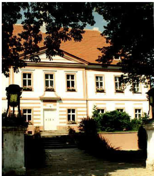
Pałac w Snowidzy

Okolo XVIII wieku założono ogród ozdobny na tarasach. Posadzone wówczas zostały m.in. platany, jesiony i klony obecnie bardzo cenne przyrodniczo. Taras w kształcie prostokąta otoczono murem z ozdobną balustradą, po której do dnia dzisiejszego zachowała się tralka i dwa cokoly. Z okresu ok. 1800 roku zachowały się relikty ozdobnej balustrady. Wysoko położony taras znajdujący się od południowej strony został wzmocniony murem oporowym z łupka ilastego, zaopatrzonym we wnęki, w połowie wysokości tego tarasu uformowano drugi znacznie większy. Przecięty został on schodami prowadzącymi z górnego ogrodu na teren fosy. Także po zachodniej stronie fosy założono dwa wąskie tarasy wzmocnione niskimi, ceglanyimi murkami, do których przylega budynek dawnej oranżerii. Oranżeria wzniesiona została wzniesiona ok. 1800 roku. Budynek posiada fasadę rozczłonkowaną arkadami i pilastrami tokańskimi. Przypuszcza się, że okolo XVIII wieku założono na terenie rezydencji ogrody ozdobne po północnej i zachodniej stronie. Najprawdopodobniej z tego też okresu pochodzi ogród warzywny i sad zlokalizowane pomiędzy zachodnim murem granicznym a terenem kościelnym. Z końcem XIX wieku posadzono w rzędzie kasztanowce wzdłuż muru okalającego dawną fosę.