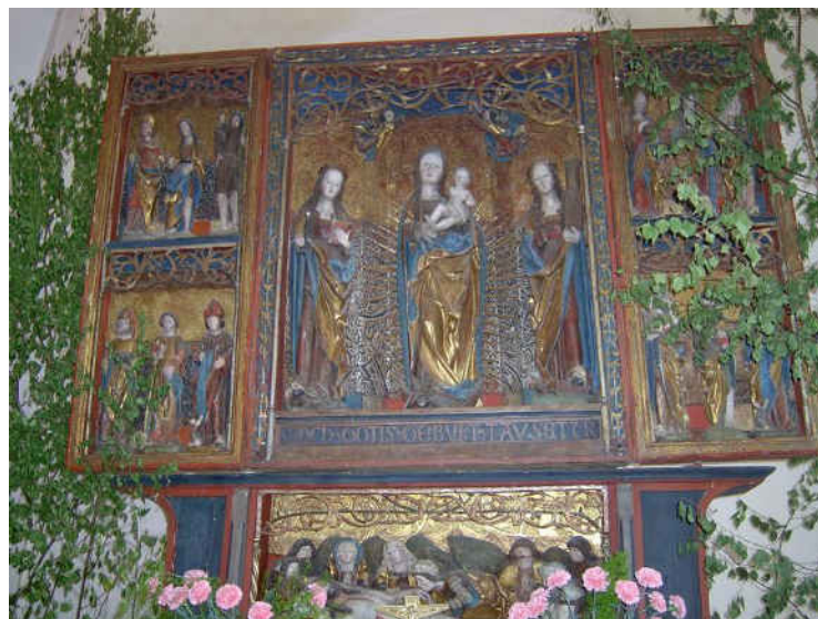
Gotycki tryptyk, fot. Mariusz Foryś

Najcenniejszym historycznie i kulturowo jest gotycki tryptyk z 1512 r., umieszczony w ołtarzu głównym.