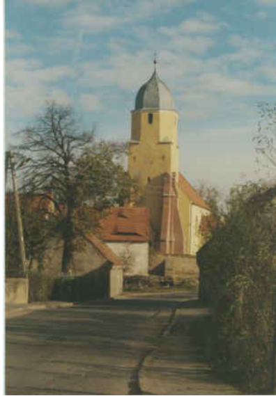
Kościół w Targoszynie, fot. Zdzisław Sokołowski

Najcenniejszym historycznie i kulturowo jest gotycki tryptyk z 1512 r., umieszczony w ołtarzu głównym.