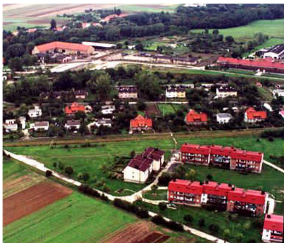
Snowidza z lotu ptaka

Wieś, położona na skraju równiny Jawora, na wys. 175-192 m n.p.m., 4 km na północny zachód od Jawora.