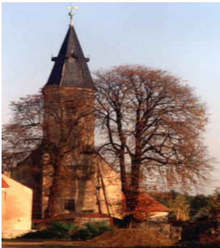
Kościół w Luboradzu